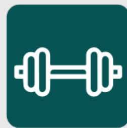
ÁREA DE CALISTENIA